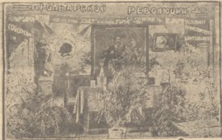
Кр. уголок котельного цеха подготовлен к встрече 16 годовщины Октябрьской революции.

Не давать пощадить разгильдяям мешающим Вологодскому вагонно-ремонтному заводу выйти с победным рапортом на Октябрьскую демонстрацию.